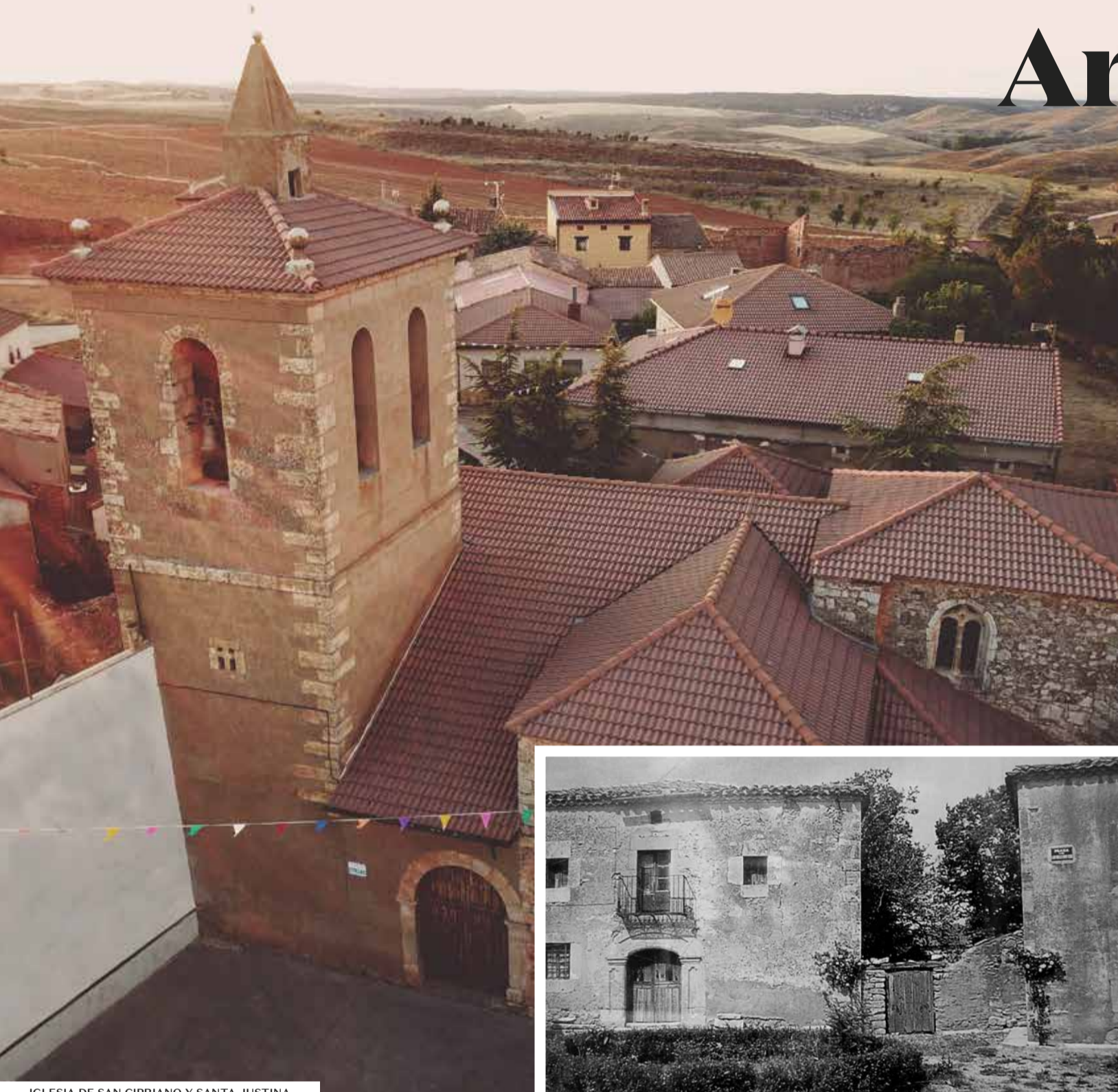
IGLESIA DE SAN CIPRIANO Y SANTA JUSTINA

Arenillas se encuentra al sur de Soria lindando su término con Guadalajara y apenas a 7 km del despoblado de Cabreriza, epicentro del “Círculo Cabreriza 2025”, la zona cero de la despoblación en nuestro país, un área de 2025 km 2 habitada por apenas 4.193 personas, poco más de 2 habitantes por km 2 . Desde los años 80 la lucha contra la despoblación ha marcado la historia de Arenillas a nivel institucional, social y cultural con dos objetivos: dinamizar la vida del pueblo y repoblarlo con nuevos habitantes. Gracias a sus esfuerzos logró rehabilitar la antigua casa del cura como albergue turístico y otros espacios municipales como viviendas de alquiler social. Ahora mismo viven 53 personas, de los cuales 10 son menores y otro más en camino.