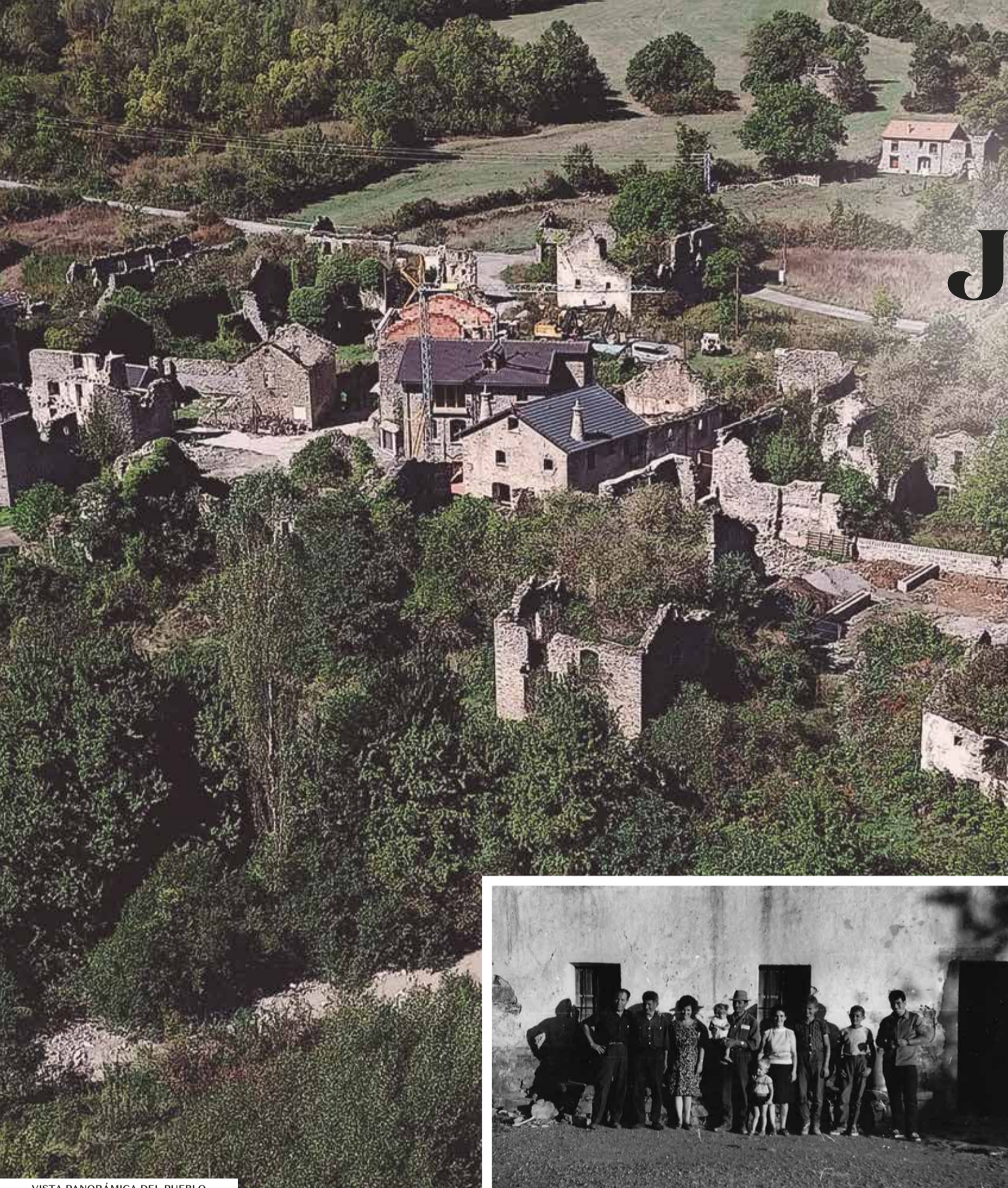
VISTA PANORÁMICA DEL PUEBLO

Acercarse hasta su mirador o a los puentes colgantes que cruzan el río Ara.