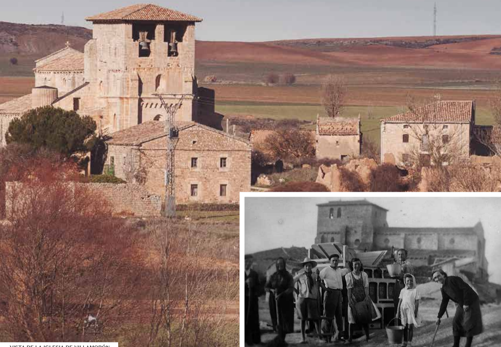
VISTA DE LA IGLESIA DE VILLAMORÓN

Villamorón se sitúa en el centro de un triángulo de indudable atractivo: muy cerca y al sur, el Camino de Santiago; también a un paso y hacia el noreste, el Geoparque de las Loras, reconocido por la Unesco; y a escasa distancia, el Canal de Castilla –con un embarcadero en Melgar de Fernamental.