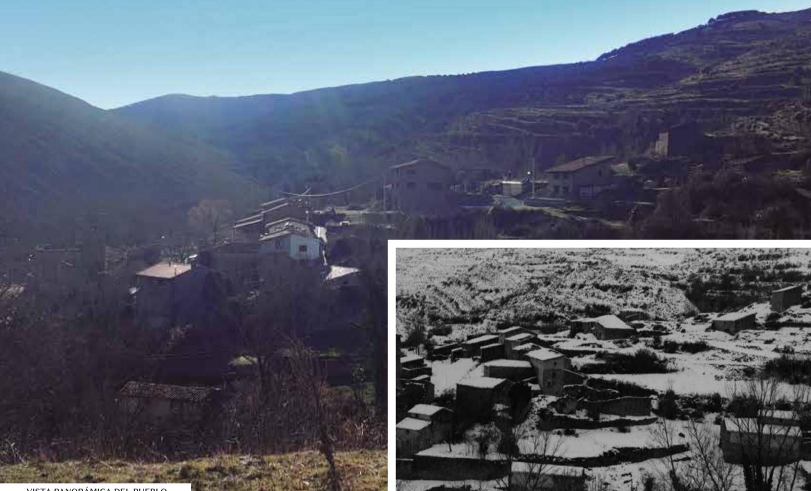
VISTA PANORÁMICA DEL PUEBLO

No tan sólo merece la pena acercarse a Poyales por su pan, sino también para descubrir sus yacimientos de icnitas, huellas de dinosaurios, frondosos hayedos y sombrías carrascas. Pero no todo se ve en el día, Poyales es también un destino starlight; uno de los cielos más despejados de Europa para observar las estrellas.