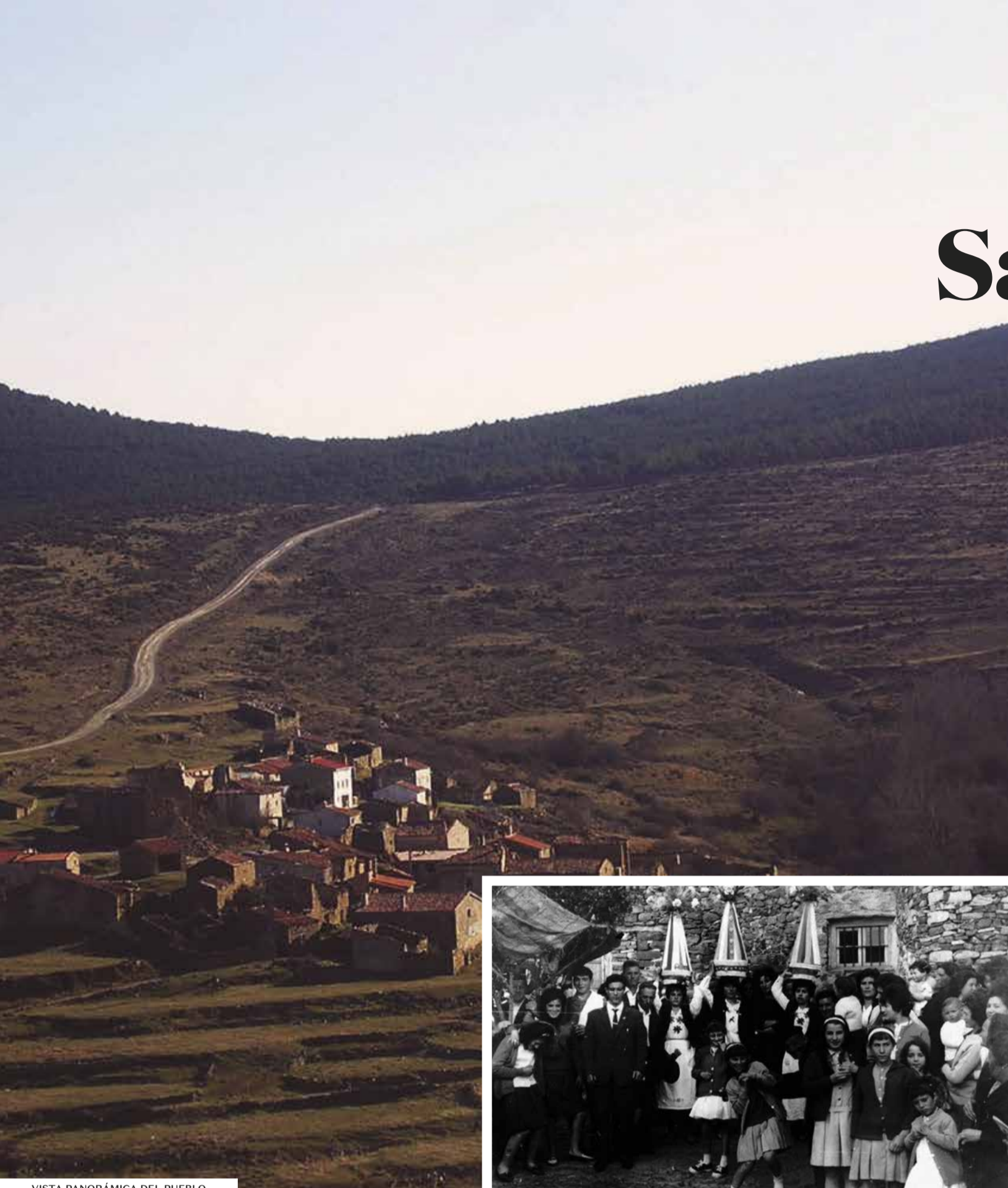
VISTA PANORÁMICA DEL PUEBLO

La Iglesia de San Bartolomé, caracterizada por una portada de primitivo románico. La colección etnográfica ubicada en lo que en su día fue la casa del maestro.