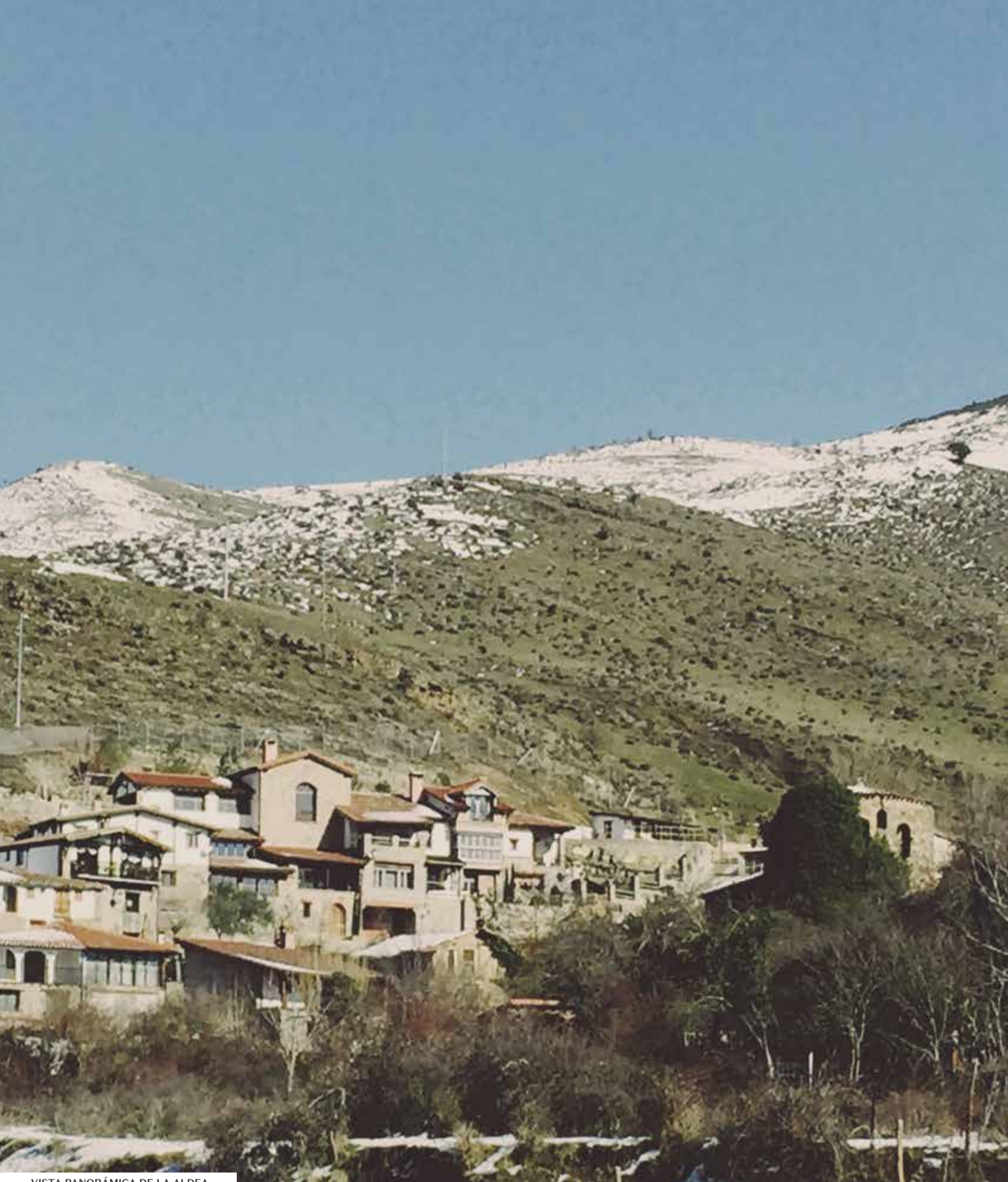
VISTA PANORÁMICA DE LA ALDEA