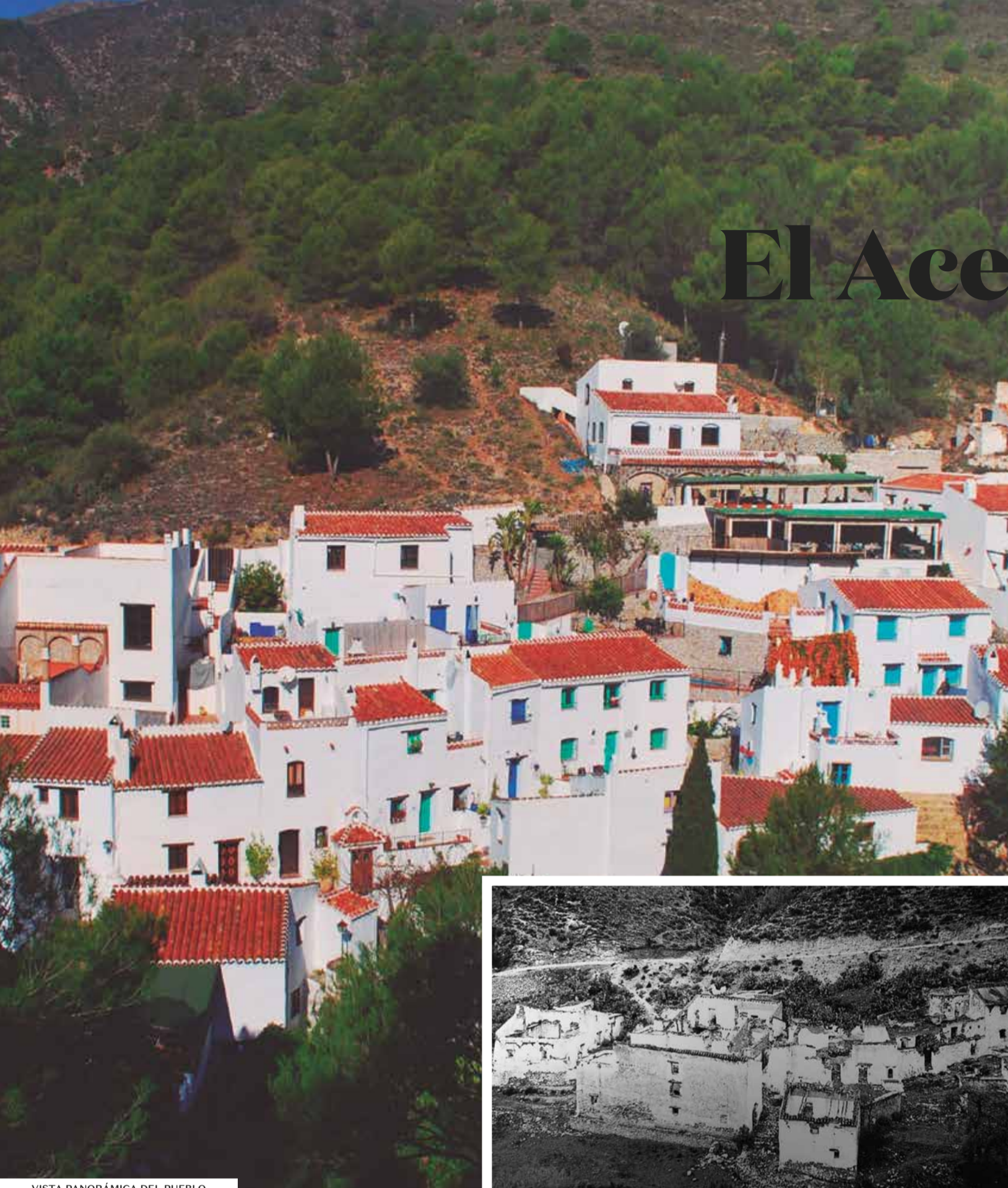
VISTA PANORÁMICA DEL PUEBLO

Además de recorrer sus empedradas calles y subir a pie hasta el Fuerte, vale la pena visitar el pueblo vecino de Frigiliana.