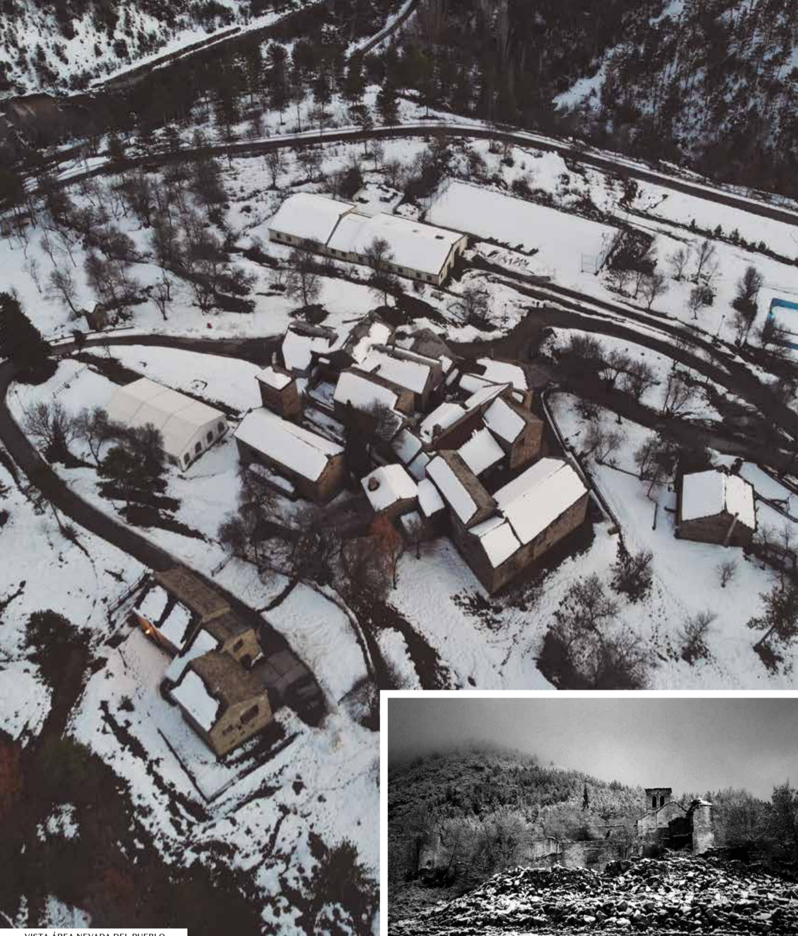
VISTA ÁREA NEVADA DEL PUEBLO