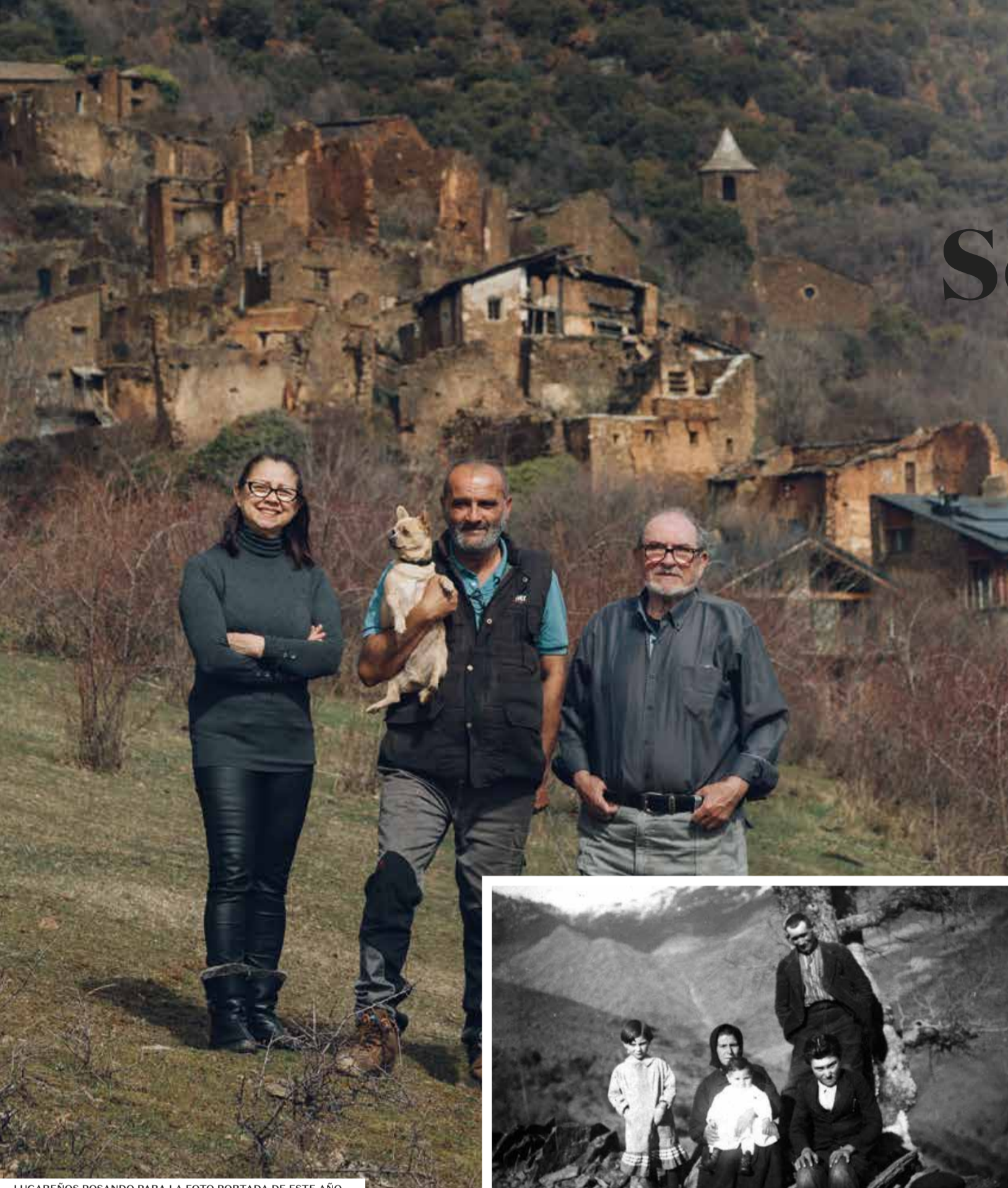
LUGAREÑOS POSANDO PARA LA FOTO PORTADA DE ESTE AÑO

Acercarse hasta su iglesia románica o bajar hasta el río para bañarse en verano. Visitar el pueblo cercano de Castellbó.