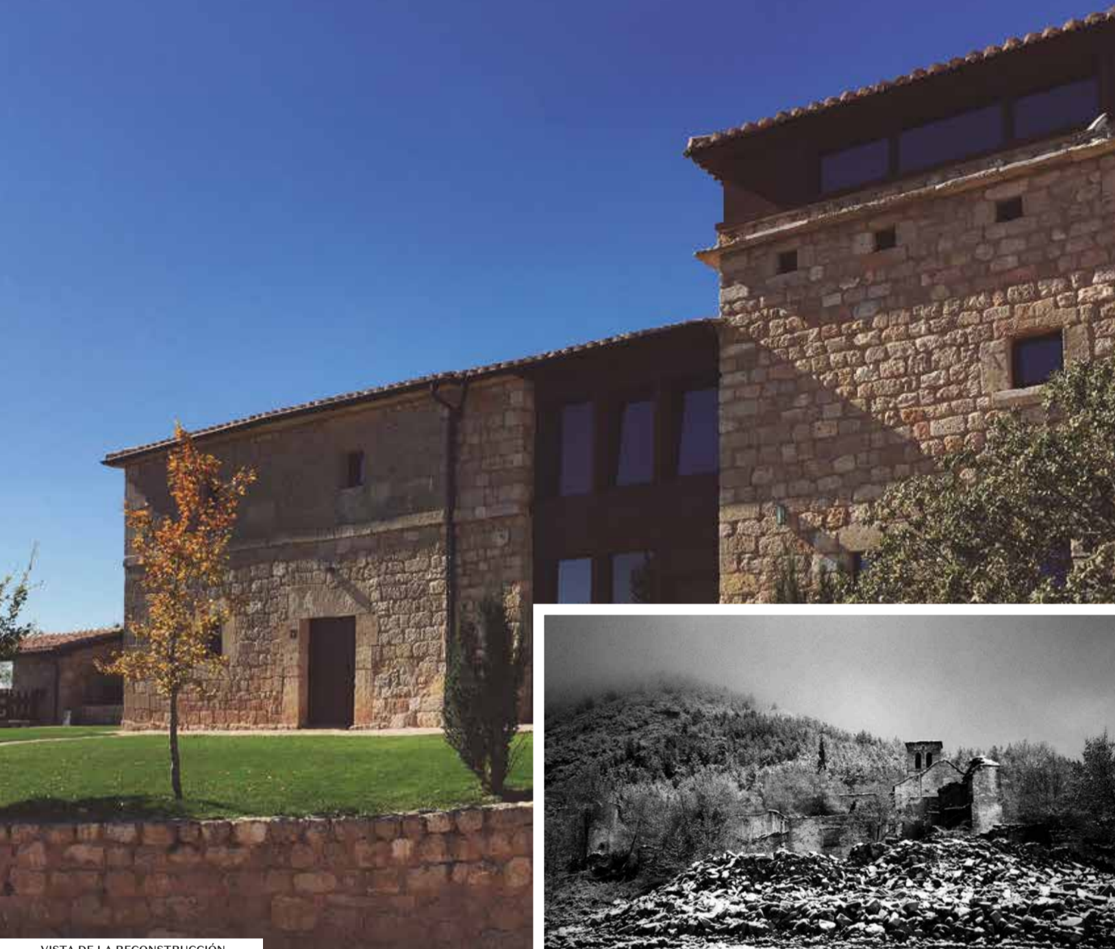
VISTA DE LA RECONSTRUCCIÓN

A menos de una hora en coche se encuentra Poza de la Sal, declarado conjunto histórico artístico, y la original Casa-Museo de Salaguti en Sasamón.