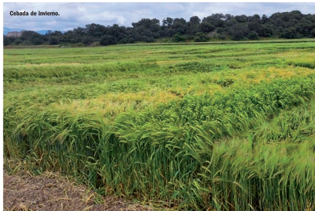
Cebada de invierno.

En este artículo se presentan los resultados de los ensayos de evaluación de nuevas variedades comerciales de cebada y trigo blando de invierno realizados por el Genvce (Grupo para la Evaluación de Nuevas Variedades de Cultivos Extensivos en España) durante la campaña 2020/21 y su análisis conjunto con la campaña anterior.